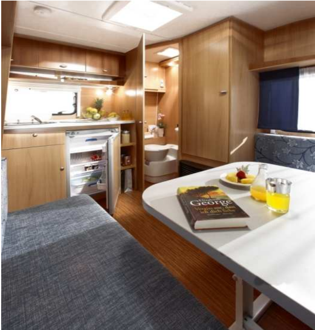
LMC caravana referente a nivel europeo ALTISIMA calidad y gran funcionalidad al justo precio