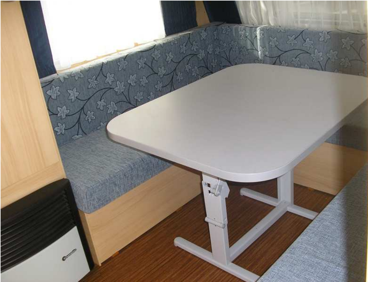
Mesa con abertura de tijera, robusta y de fácil manejo