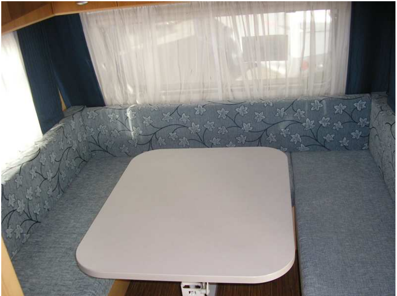
Gran salón comedor en forma de rotonda