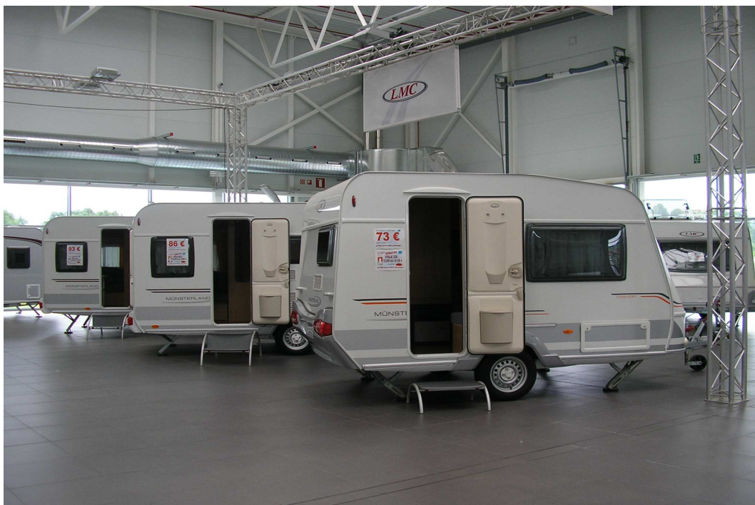
LMC caravana referente a nivel europeo ALTISIMA calidad y gran funcionalidad al justo precio Gran oportunidad ultimas unidades a un precio irrepetible 8.466 +IVA