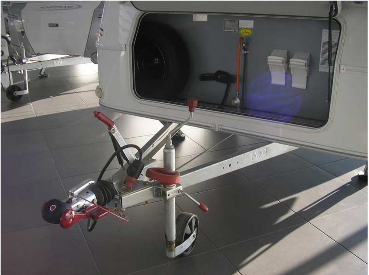
Arcon de grandes dimensiones, Chasis Alko con estabilizador y Rueda de recambio