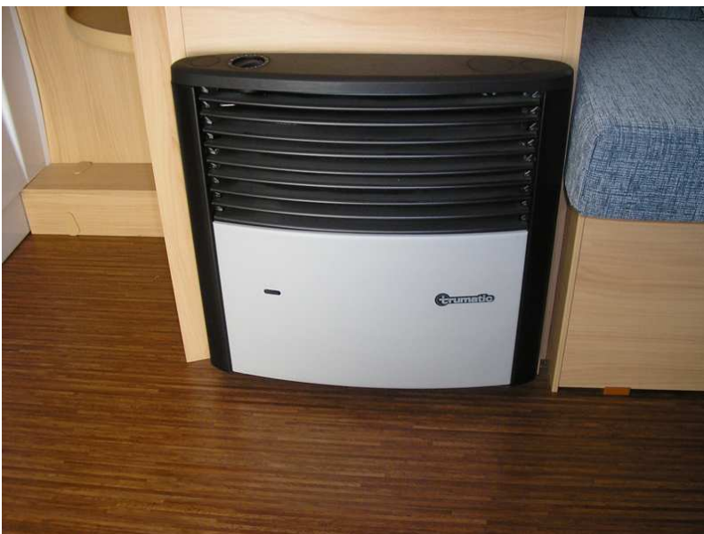
Calefacción Truma 3002 SL, nos permite el caravanismo incluso en época invernal