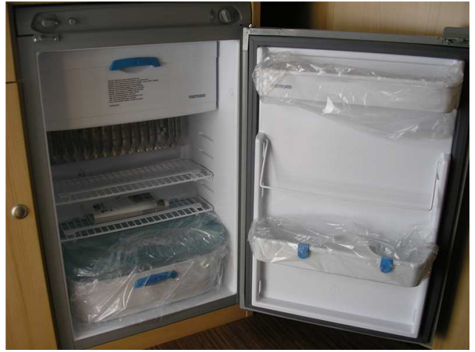
Cocina distribución Francesa, nevera de 90 L